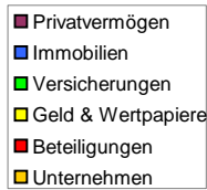
Vermögenswerte nach Klassen